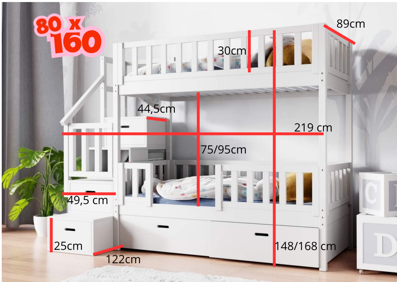
Stapelbed met trap 80x160