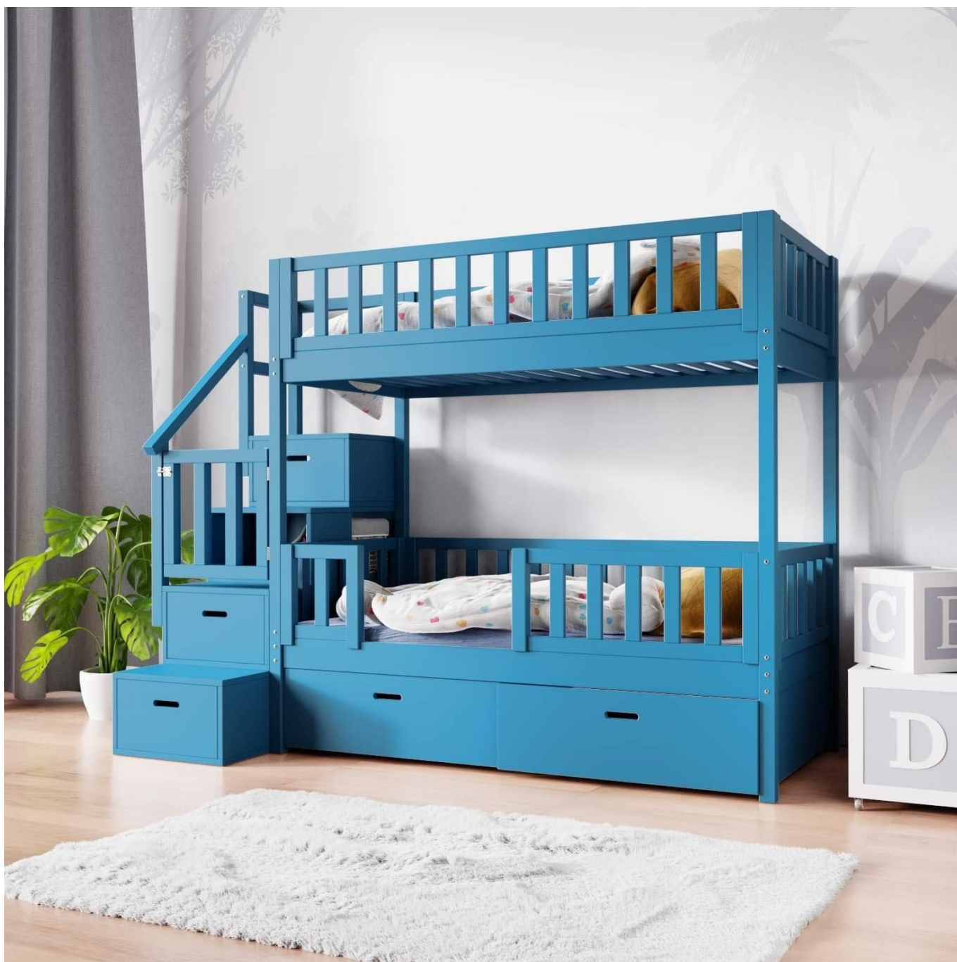
Kinder stapelbed met trap